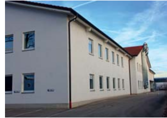
Aladin, 1.500 qm 2