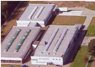
Eltosch Grafix, 4.500 qm 2