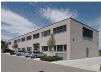
PrintConcept, 1.500 qm 2