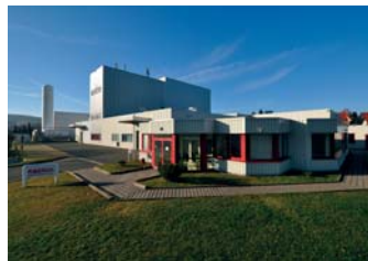
Raesch Quarz GmbH, 2.100 qm 2