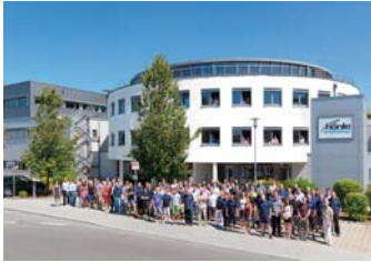
Dr. Höhle AG, Produktionsfläche: 4.500 qm 2