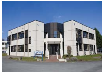
Panacol Elosol GmbH, 500 qm 2