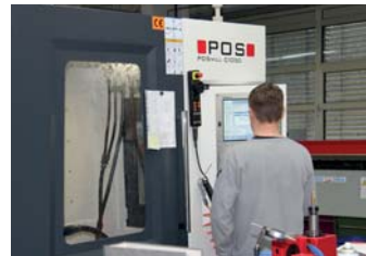
Fräsen eines Werkstücks

und flexibel zu erfüllen. Für die anspruchsvolle Fertigung aller Komponenten setzen wir auf hochmoderne Maschinen wie CNC-Dreh- und Fräsmaschinen.