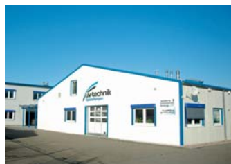
UV-Technik Speziallampen GmbH, 1.500 qm 2