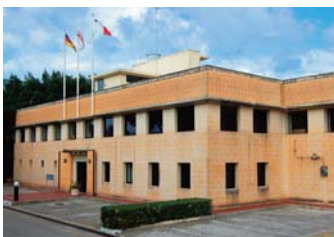
Raesch Quarz (Malta) Ltd, 3.500 qm 2